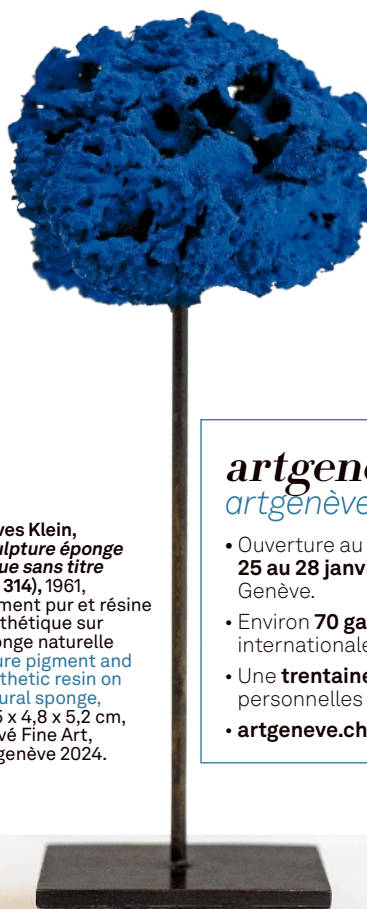
↑ Yves Klein, Sculpture éponge bleue sans titre (SE 314) , 1961, pigment pur et résine synthétique sur éponge naturelle / pure pigment and synthetic resin on natural sponge, 15,5 x 4,8 x 5,2 cm, Clavé Fine Art, artgenève 2024.