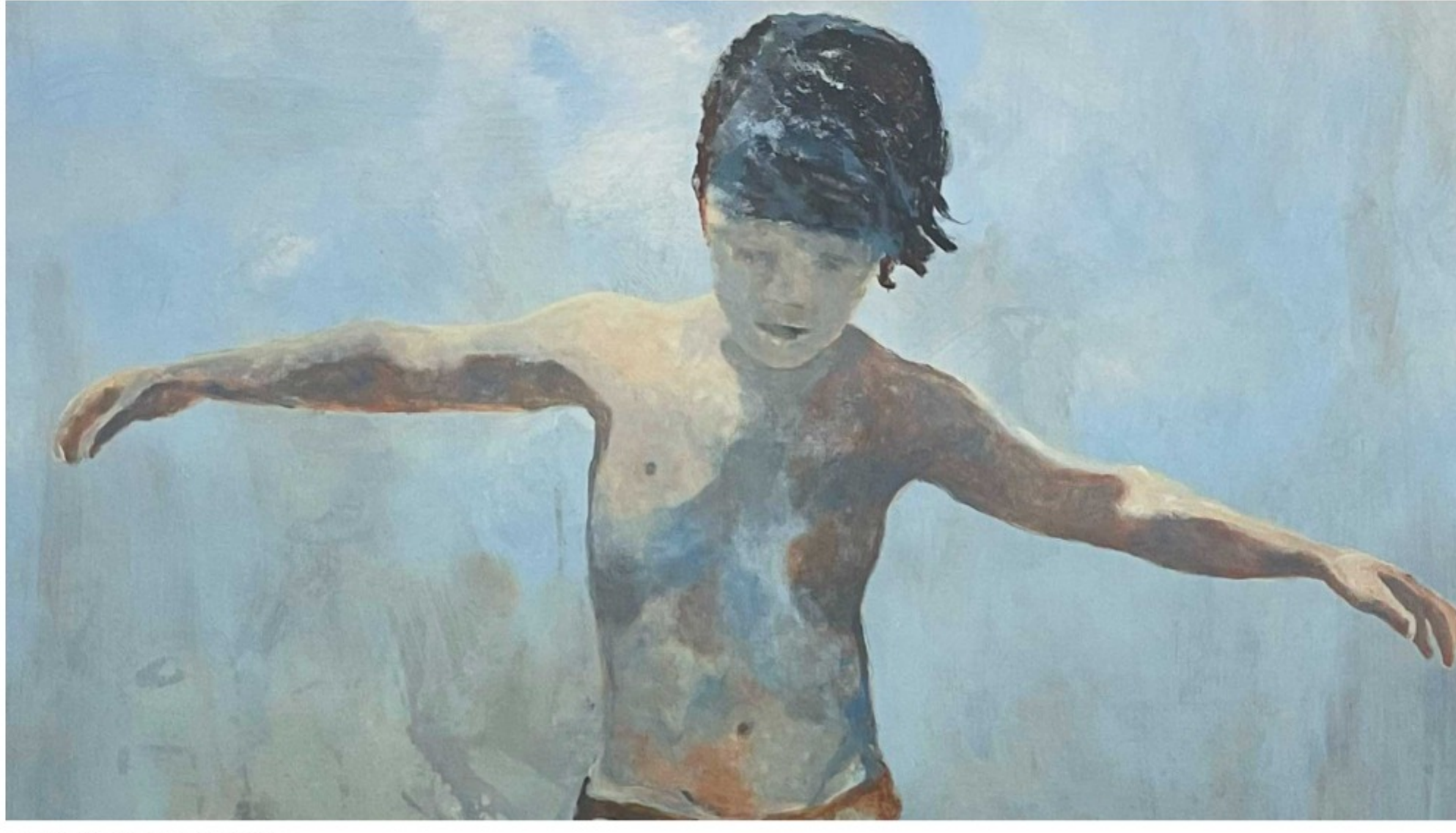
Edl Dubien, Sans titre