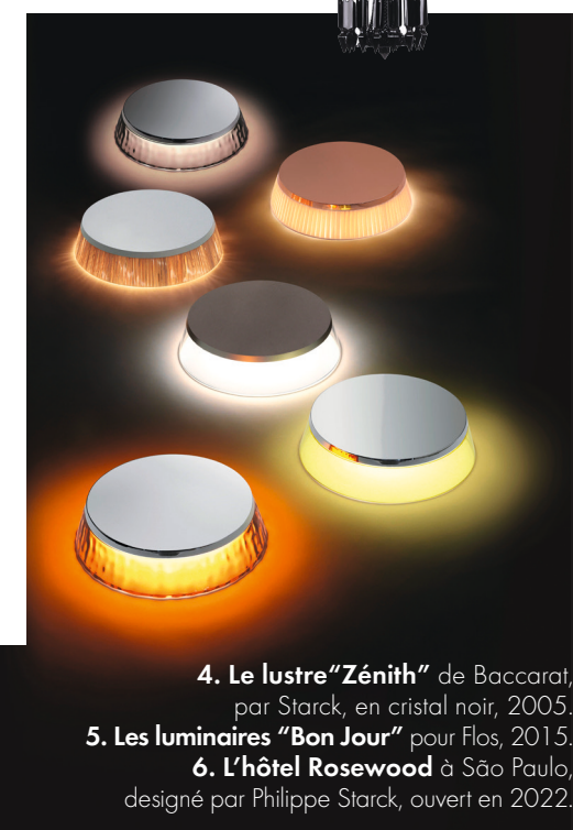
4. Le lustre "Zénith" de Baccarat, par Starck, en cristal noir, 2005. 5. Les luminaires "Bon Jour" pour Flos, 2015. 6. L'hôtel Rosewood à São Paulo, designé par Philippe Starck, ouvert en 2022.