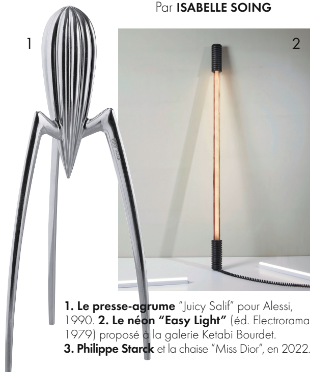
1. Le presse-agrume "Juicy Salif" pour Alessi, 1990. 2. Le néon "Easy Light" (éd. Electrorama, 1979) proposé à la galerie Ketabi Bourdet. 3. Philippe Starck et la chaise "Miss Dior", en 2022.